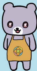
AMANEKUラボ 公式キャラクター「くますけ」